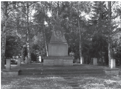
Обелиск советским военнопленным на кладбище 13а Вольфенбюттель