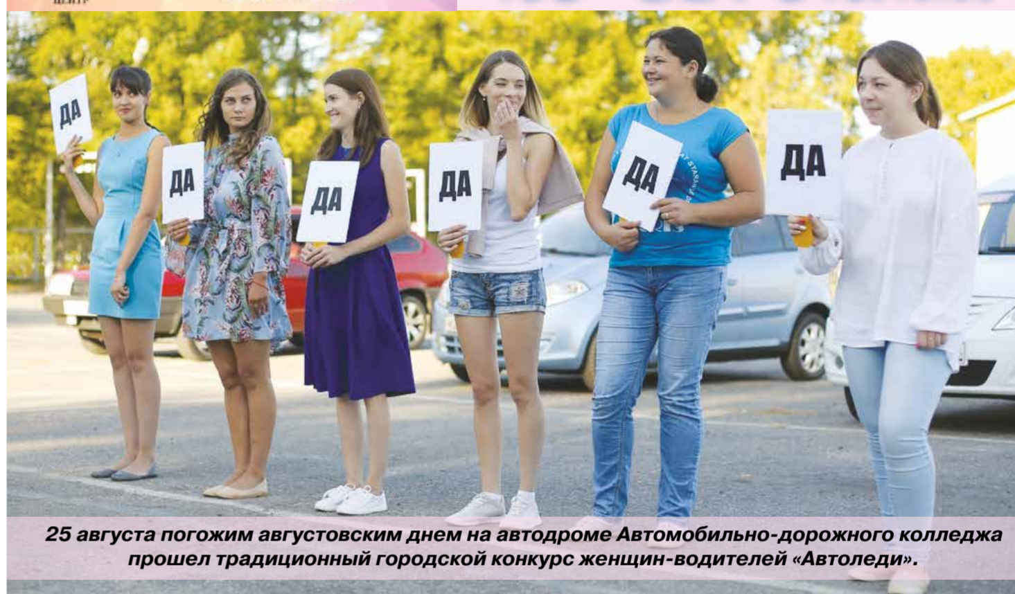
25 августа погожим августовским днем на автодроме Автомобильно-дорожного колледжа прошел традиционный городской конкурс женщин-водителей «Автоледи».