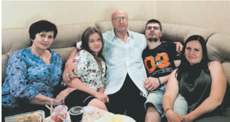
С мужем, дочерью и внуками