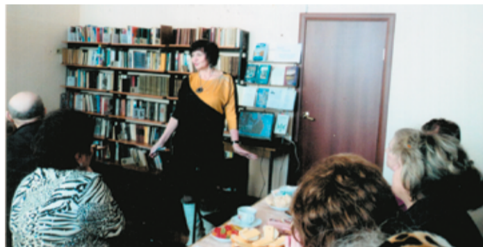
На встрече с читателями

для нас большой дом, всю необходимую мебель сделал сам. Находил он время и для книжечтения и нас к этому приобщал. Со временем собралась своя большая домашняя библиотека, и я до сих пор помню, как у нас проходили семейные чтения. Бывало, зимой, мы все вместе, сидя у печки, подолгу обсуждали прочитанное. Сама я тоже читала охотно, и от полученных впечатлений уже в детстве