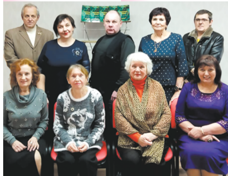
С поэтами из ЛИТО «Содружество»