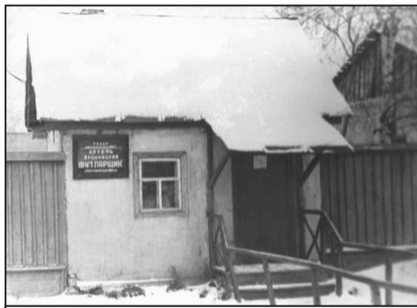
Артель, с которой началась «Кожгалантерейка»