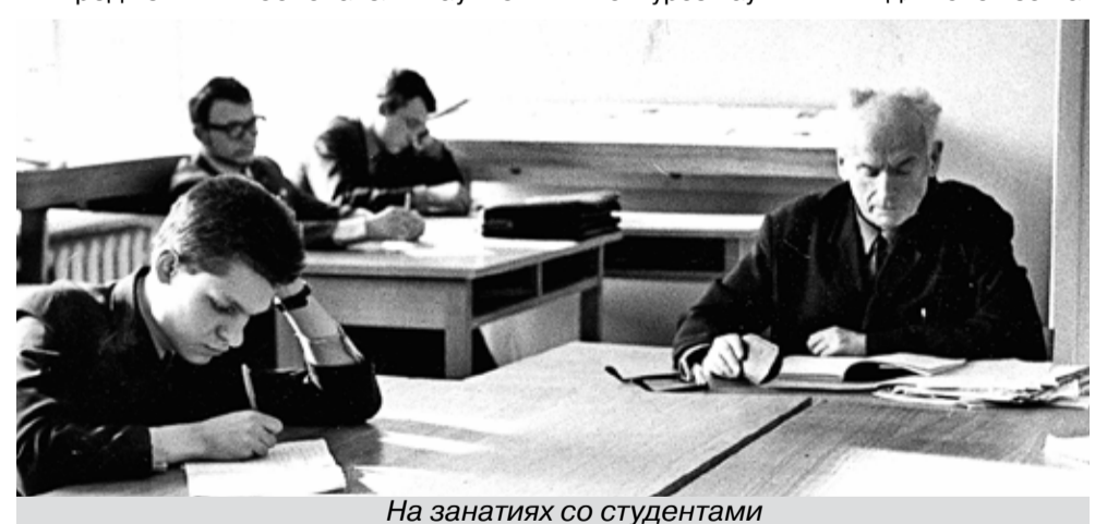
На занятиях со студентами

В их числе были именитые педагоги-предметники: основатель научной