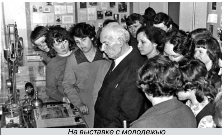
На выставке с молодежью