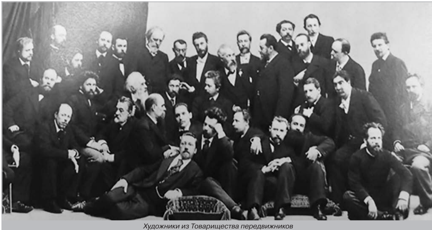
Художники из Товарищества передвижников