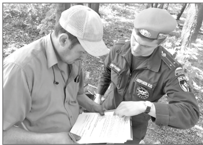
Корр. «БН» (по информации ГУ МЧС России по МО)

На сегодняшний день возбуждено 579 административных дел. В 288 случаях нарушителям вынесено предупреждение, в 283 – выписан штраф на общую сумму 616 тысяч рублей. На рассмотрении находятся восемь административных дел.