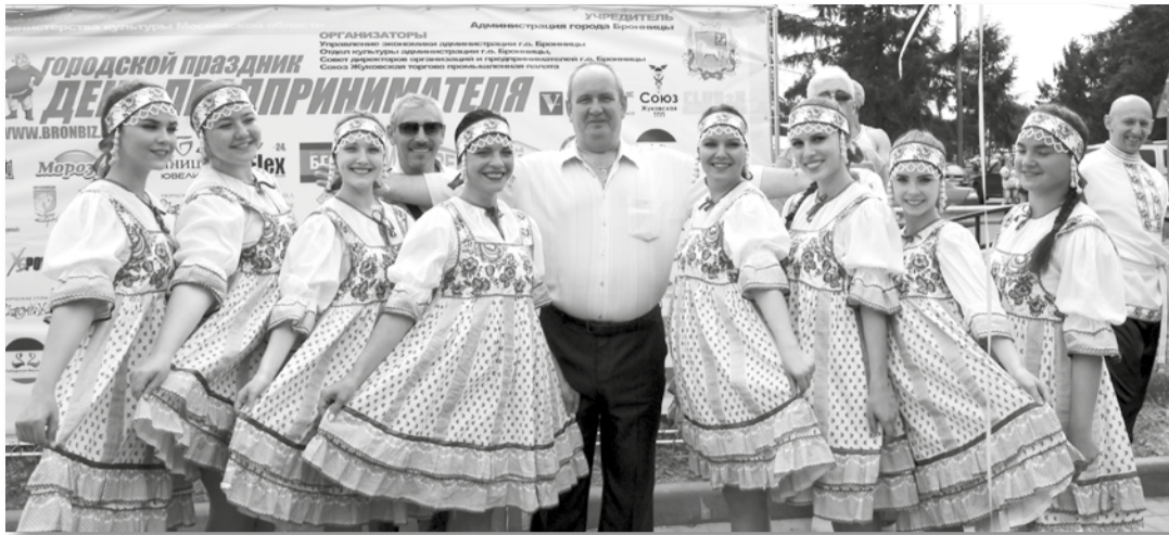
Начало на 1 стр.

Уже второй год в Bronnitsy столь масштабно, в общегородском формате, проводится День предпринимателя. И это неудивительно: ведь представители нашего делового сообщества – люди энергичные, инициативные, умеющие организовать и успешно развить не только свой бизнес, но и любые городские торжества. Они способны найти и прочно занять свое место в экономике города и области, воплощать в жизнь новые идеи и проекты – это талант и одновременно большой труд, достойный уважения и поддержки!