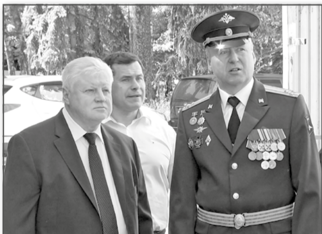
Сергей МИРОНОВ, председатель партии «Справедливая Россия»:

– В этом году нашему испытательному центру исполняется 64 года. У нас проходит испытания в различных дорожных и климатических условиях вся военная специальная техника, которая базируется на колесных автомобильных шасси. До недавнего времени двузвенные гусеничные тягачи перевозились различными способами гражданскими автопоездами. Сейчас, по техническому заданию Главного автобронетанкового управления, разработан новый автопоезд – раздвижной полуприцеп для перевозки без расцепления звеньев двузвенных гусеничных тягачей, весом 10, 20 и 30 тонн для Арктики, который в настоящее время проходит испытания.