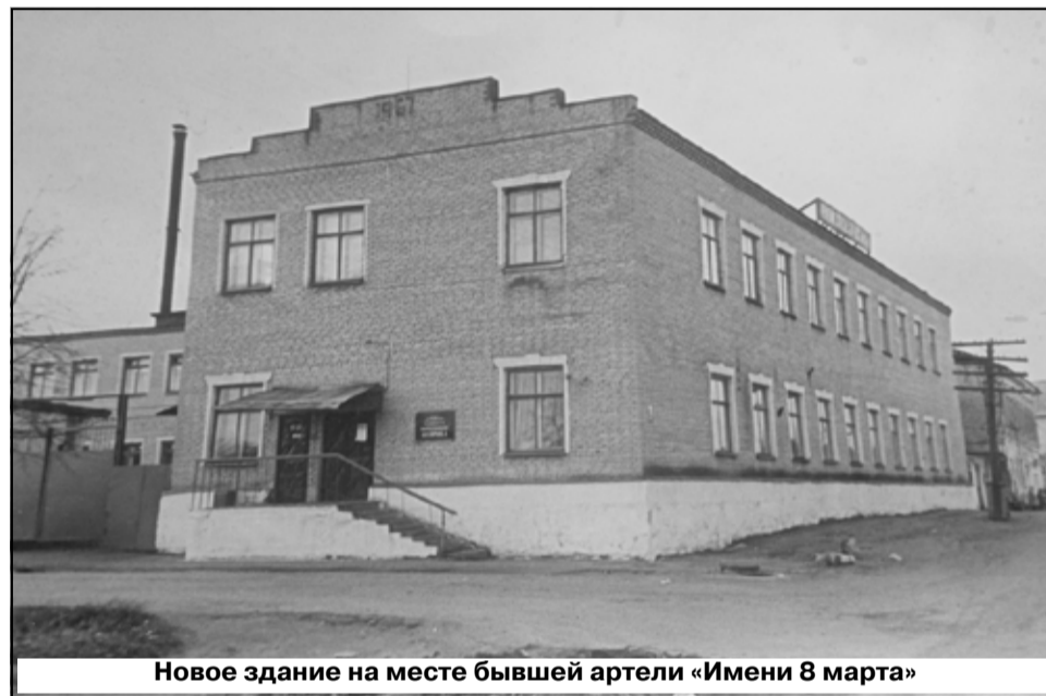
Новое здание на месте бывшей артели «Имени 8 марта»

Весомая часть ассортимента товара, которая выпускалась в трикотажной арте-